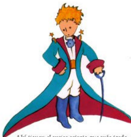
Aquí tienen el mejor retrato que más tarde logré hacer de él

Me puse en pie de un salto como herido por el rayo. Me froté los ojos. Miré a mi alrededor. Vi a un extraordinario muchachito que me miraba gravemente. Ahí tienen el mejor retrato que más tarde logré hacer de él, aunque mi dibujo, ciertamente es menos encantador que el modelo. Pero no es mía la culpa. Las personas mayores me desanimaron de mi carrera de pintor a la edad de seis años y no había aprendido a dibujar otra cosa que boas cerradas y boas abiertas.